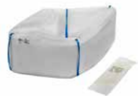
30.84.64.2800 Longopac Beutel