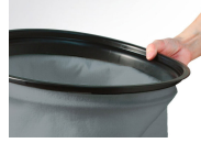
GHIBLI Stoffilter t.b.v. AS 59/60 IK HD (Grijs)