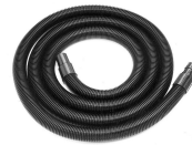
GHIBLI Flexibele slang